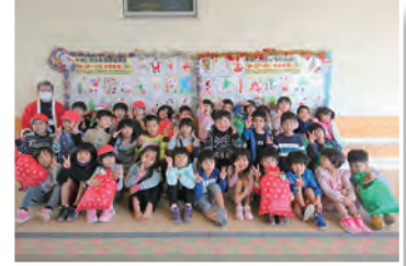
▲はっぴ〜くりすます会