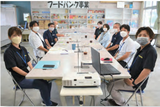
▲公益的な取り組み実施に向けた連絡会を終えて

村内の社会福祉法人等の強みを繋ぎ、地域福祉の更なる充実を目指す「ちゅいしい事業」。6月16日（木）、同事業の参画団体による連絡会が村社協で開催された。会では、各法人が協働して取り組んでいる「フードバンク事業（1人1品持ち寄り運動）」の進捗報告や、利用者等から拾い上げた困り事を、参画法人が連携を図り、迅速に支援に繋げる「法人連型なんでも相談窓口」設置に向けた意見交換が行われた。