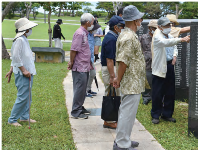
▲礎を見つめる参加者