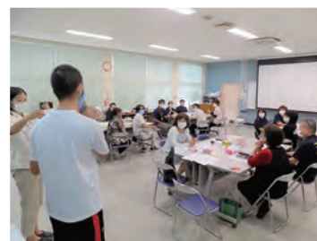
▲ちゅいしいじい連絡会