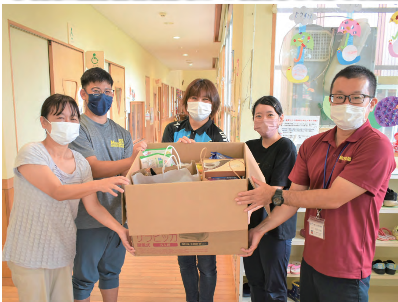
▲今回で2度目となる活動。今帰仁保育所の皆様に感謝。