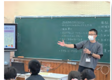
▲福祉教育（兼小にて）