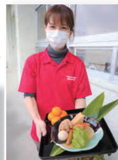
▲ヘルパーの手作りプレゼント