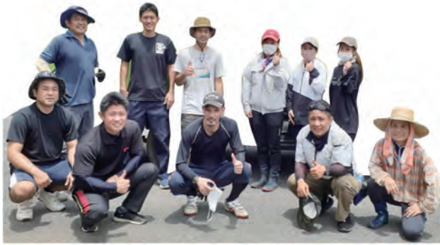
▶シマへの愛が溢れる青年会

「地域の絆と感謝の気持ち」そして「シマへの愛」が青年会活動の原動力となっている。