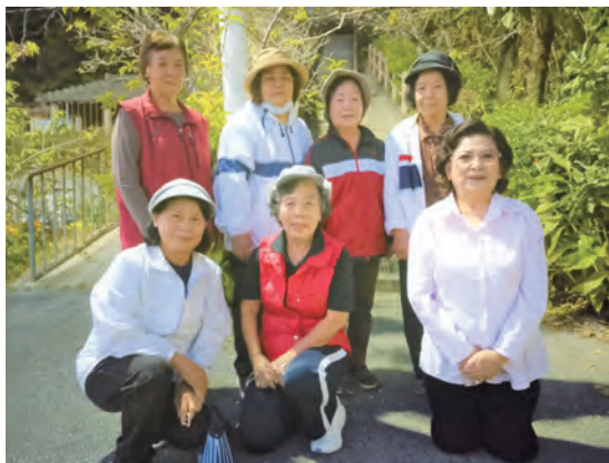
▲夕方の仲宗根区お宮前にて