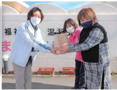
▲まほろば保育園（右側）から