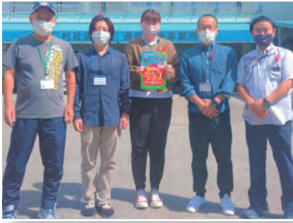
▲村社協のコーディネーター

なきじん見守り隊が協働して活動に取り組み、住民票で独居世帯となつていいる429世帯の把握に取り組んだ。