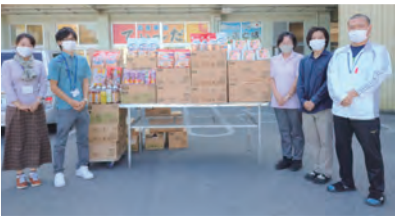
▲村役場福祉保健課から

（村新型コロナウイルス感染拡大防止緊急支援事業より、賞味期限が迫った品を有効活用して下さいました。）